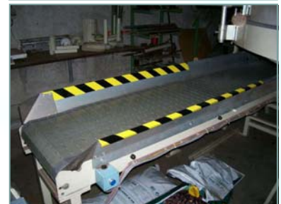
Zakgoedcontrol. (Wegend sectie in bestaande band.)