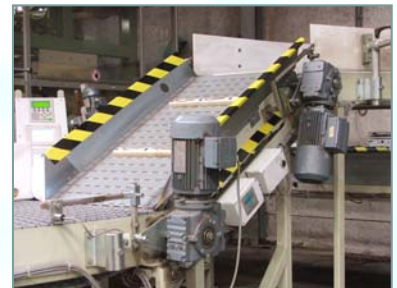
Zakgoedcontrol. (Band volledig wegend)