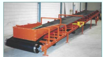
Transportband (Wegend trogstel)